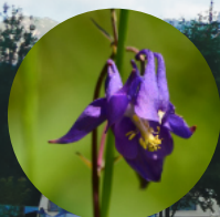
Ancolie noirâtre Aquilegia atrata

Une expérience enrichissante à renouveler !