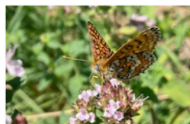
Mélitée du plantain Melitaea cinxia