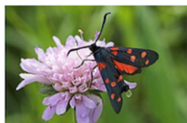
Zygène de la coronille Zygaena ephialtes