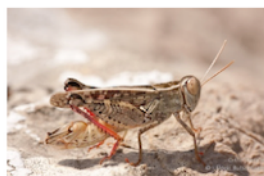
Criquet italien Calliptamus italicus