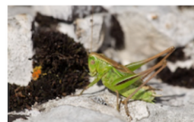
Decticelle bicolore Metriopectera bicolor