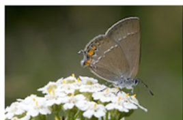
Thècle de l'amarel Satyrrium acaciae

Nous rappelons que toutes les données de nos inventaires sont transmises aux bases de données nationales (InfoSpecies).